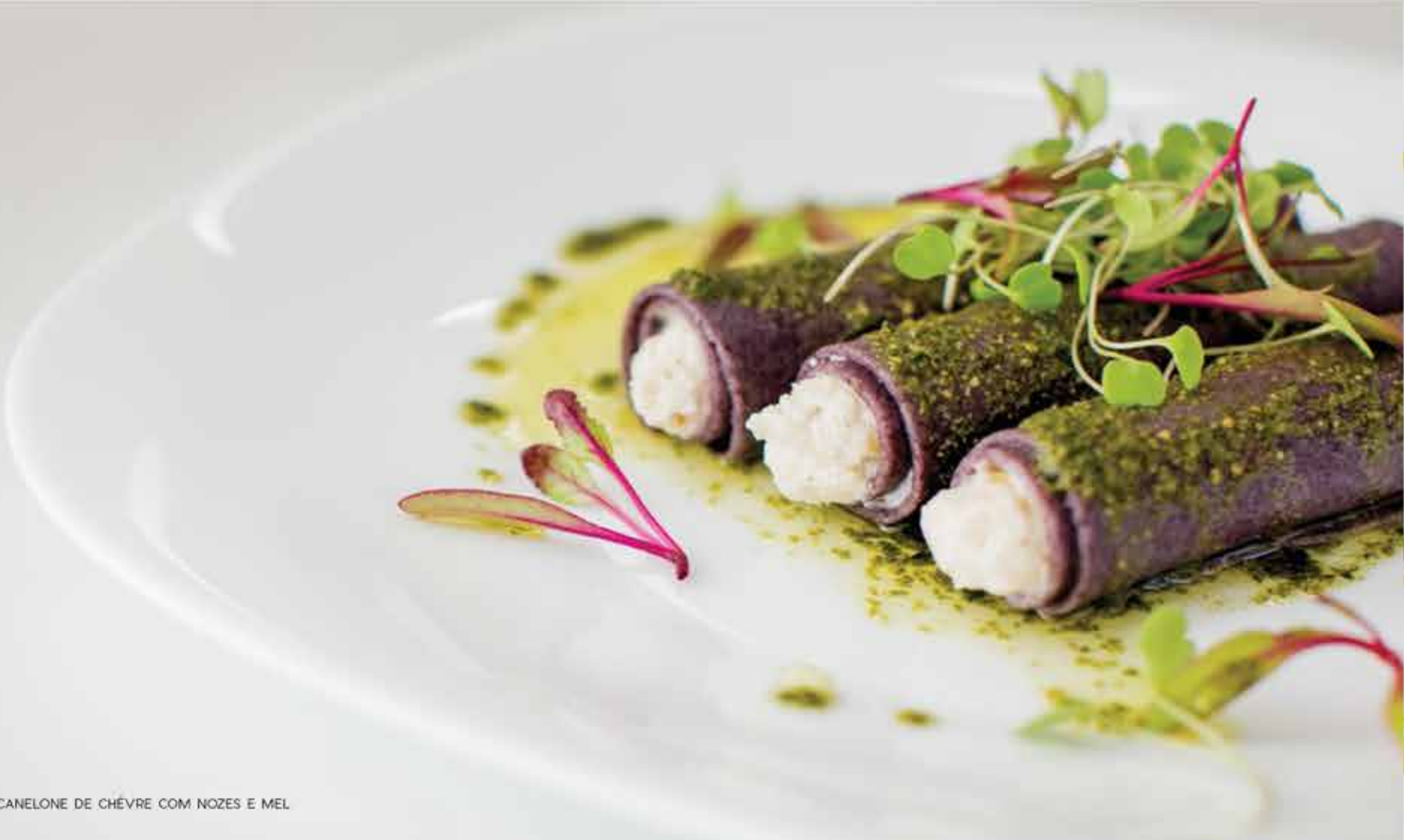
CANELONE DE CHÈVRE COM NOZES E MEL